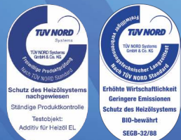
Guard Thermic Guard BioThermic

Der TÜV NORD überprüft und bestätigt regelmäßig die Effizienz unserer Additive.